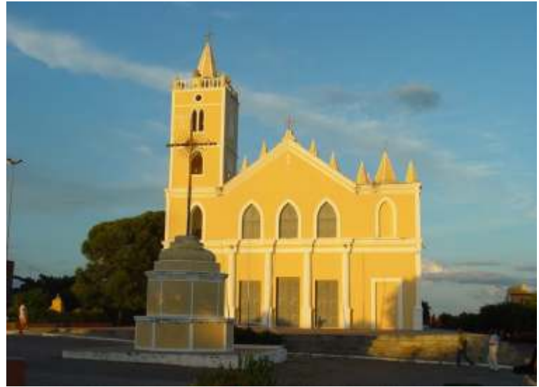
Figura 01 - Igreja Matriz de Nossa Senhora de Santana, localizada no município de Campo Grande/RN.

O tombamento é um ato administrativo realizado pelo Poder Público com o objetivo de preservar, por intermédio da aplicação de legislação específica bens de valor histórico, cultural, arquitetônico, ambiental e também de valor afetivo para a população, impedindo que venham a ser destruídos ou descaracterizados.