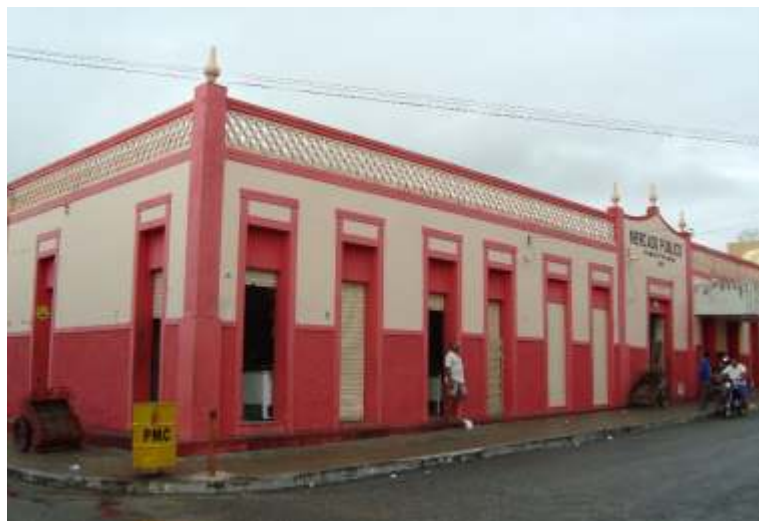
Figura 04 - Mercado Público do município de Caraúbas.

Sim. Desde que o bem continue sendo preservado. Não existe qualquer impedimento para a venda, aluguel ou herança de um bem tombado. No caso de venda, deve ser feita uma comunicação prévia a instituição que efetuou o tombamento, para que esta manifeste seu interesse na compra do mesmo.