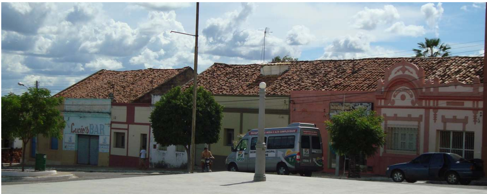
Figura 02 - Belo conjunto de edificações com valor histórico-cultural, localizado na Rua N.S. da Conceição, município de Apodi/RN.

O tombamento é uma ação administrativa do poder executivo, que começa pelo pedido de abertura de processo, por iniciativa de qualquer cidadão ou instituição pública. Esse processo, por avaliação técnica preliminar, é submetido à deliberação dos órgãos responsáveis pela preservação. Caso seja aprovada a intenção de proteger um bem cultural ou natural, é expedida uma notificação ao seu proprietário. A partir desta notificação o bem já se encontra protegido legalmente, contra destruições ou descaracterizações até que seja tomada a decisão final. O processo termina com a inscrição no livro tombo e comunicação formal aos proprietários.