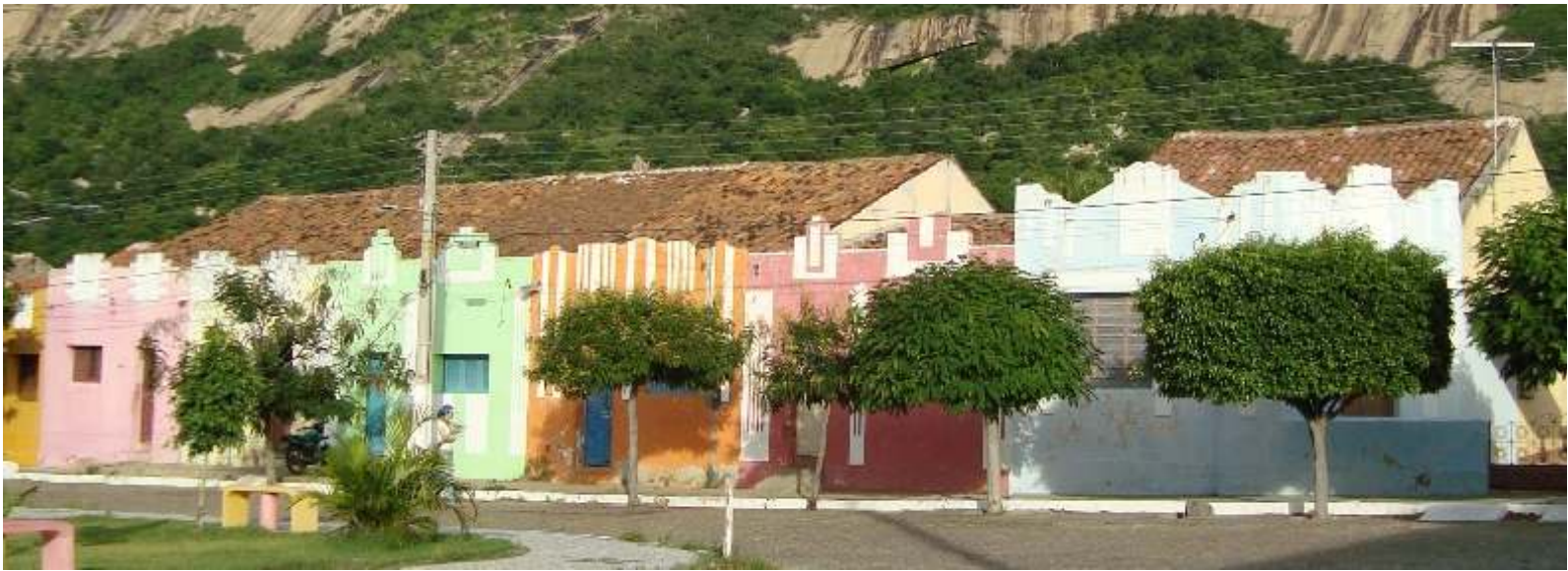
Figura 05 - Belo conjunto de edificações com valor histórico-cultural, localizado na Rua Miguel Godeiro, município de Patu/RN.