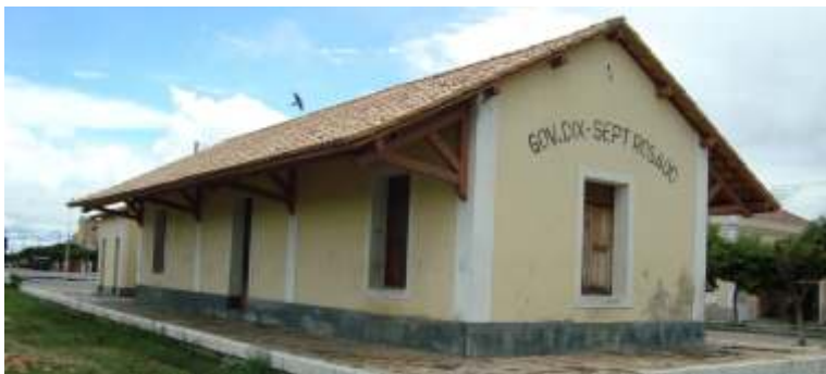
Figura 06 - Antiga estação de trem do município de Governador Dix-Sept Rosado/RN.

(O texto desta cartilha foi adaptado da publicação “Tombamento e Participação Popular” do Departamento do Patrimônio Histórico, do município de São Paulo).